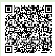
「ラーケーションの日」ポータルサイト

「ラーケーションの日」には、様々な活動ができます。どのような活動ができるのか、どうやって「ラーケーションの日」を取ればよいのかなど、興味をもった人は、おうちの方に配った「保護者用リーフレット」を見たり、右の二次元コードから、「ラーケーションポータルサイト」を見たりしながら、おうちの方と話し合ってください。